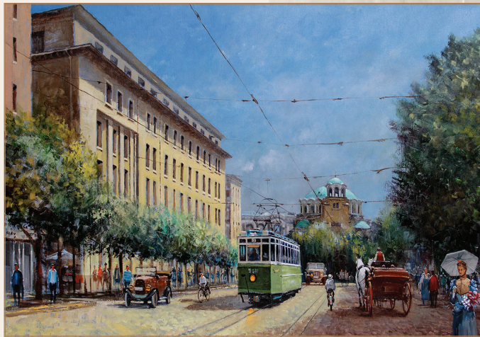
автор Костадин Станоев

На 03.04.1912 г. е обнародван Законът за административното правосъдие, с който е учреден Върховният административен съд (ВАС). На него са били подсъдни всички жалби срещу административните актове на публичните власти, доколкото не са били изключени със закон. Правомощията на ВАС са ограничени с промени в Закона за административното правосъдие от 1915 г. и 1922 г., но в периода 1924-1928 г. с нови закони се възстановява и разширява административното правосъдие. С Наредба-закон от 12.11.1934 г. ВАС получава самостоятелна правна уредба.